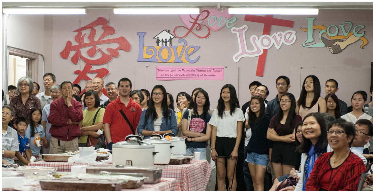
Ottawa senators' jersey after Cal's top 10 moments in CCCO