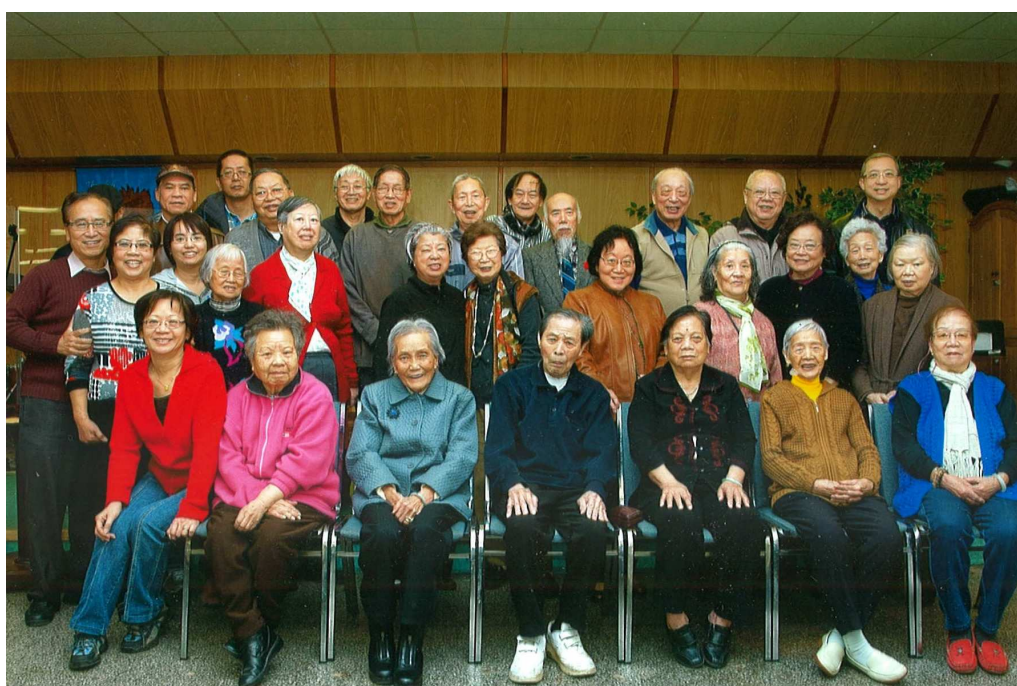
上图：2014年的迦勒團 Above: Caleb Fellowship in 2014