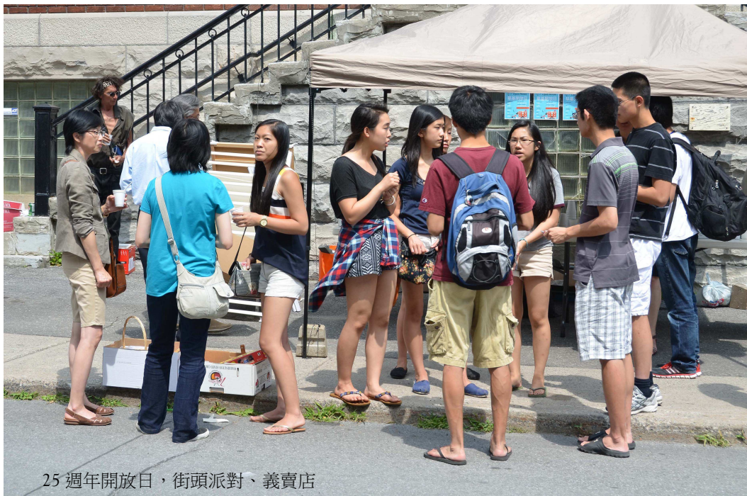
25週年開放日，街頭派對、義賣店

在我之前，有著許多年長的弟兄姊妹，他們憑著信心，努力不懈的創辦華基，更有其他的會眾信徒一直以來一心事主。為著這些讚美神我神！讓我們今後，繼續忠心，順從響應天父更多的呼召，把福音傳至地極！