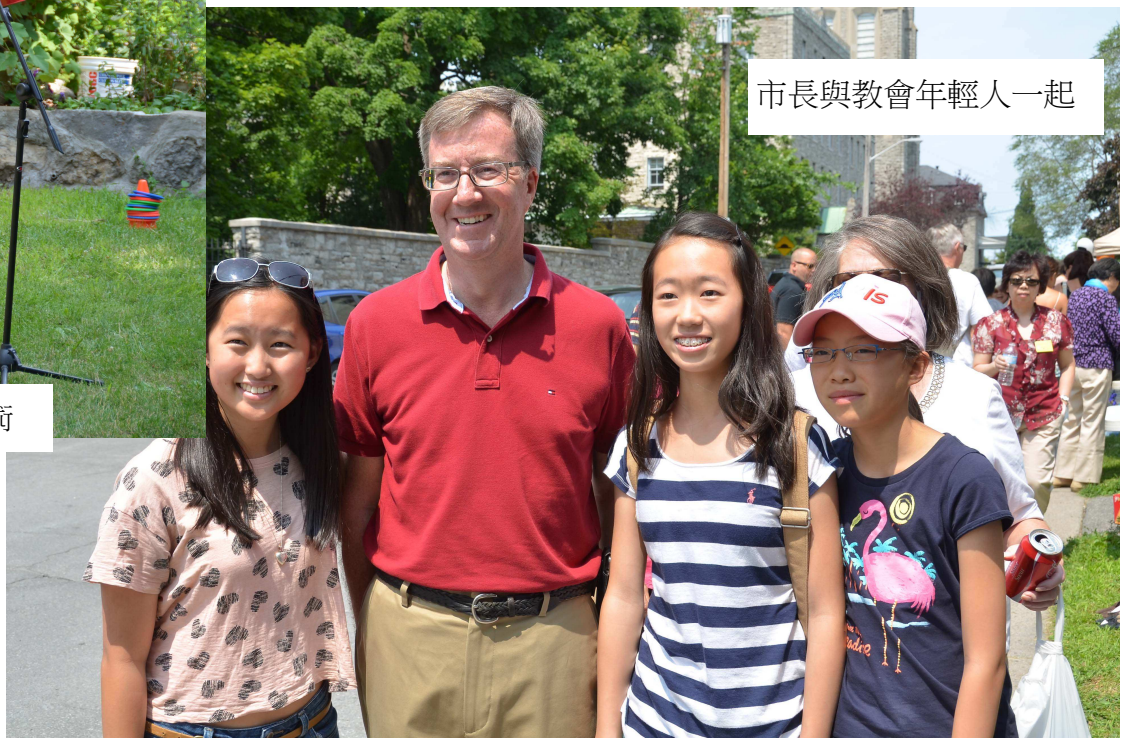
市長與教會年輕人一起