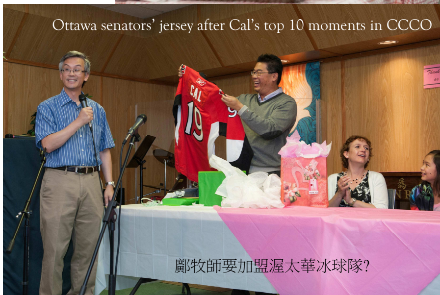
鄺牧師要加盟渥太華冰球隊?