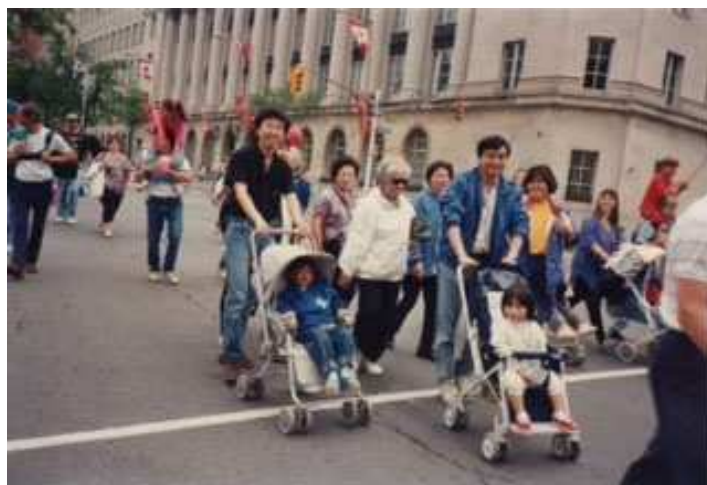
上圖：1994年的迦勒團 Photo Above: Caleb Fellowship in 1994